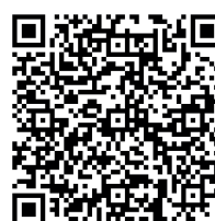
Kod QR nr 0.

Podkreśl, że polityka tworzenia parapaństw na terenie dawnych republik radzieckich ma za zadanie przede wszystkim osłabić te kraje, które wbrew Rosji weszły na drogę samodzielności i zwróciły się w stronę Zachodu. Rosja dąży do wywierania nacisku na dawne republiki oraz odzyskania nad nimi kontroli poprzez umieszczenie w nich rosyjskich baz wojskowych, ale też w drodze federalizacji, czyli dołączania parapaństw jako podmiotów i odłączania ich od istniejących krajów.