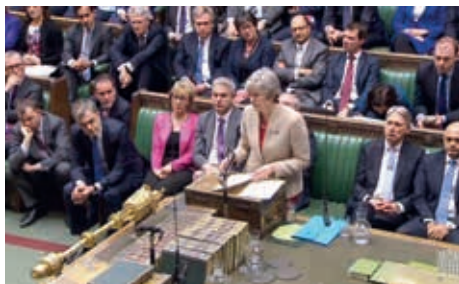
▲ Izba Gmin w Pałacu Westminsterskim w Londynie. Wystąpienie premier Theresy May, marzec 2019 rok.

W średniowieczu bardzo rzadko (w zakonach i miastach) uciekano się do rozwiązań demokratycznych. Wielkie znaczenie miało jednak rozwinięcie idei reprezentacji. W monarchii stanowej władca potrzebował dla swoich posunięć aprobaty ze strony przedstawicieli stanów – przede wszystkim szlacheckiego i duchownego (znacznie mniejsze uprawnienia mieli przedstawiciele miast, a chłopci najczęściej w ogóle nie byli reprezentowani). Coraz większe znaczenie zyskiwała rzymska zasada „to, co dotyczy wszystkich, powinno być przez wszystkich aprobowane”. W średniowieczu stworzono także teorię oporu wobec władzy – królowi, który łamał prawo, można było odmówić posłuszeństwa.