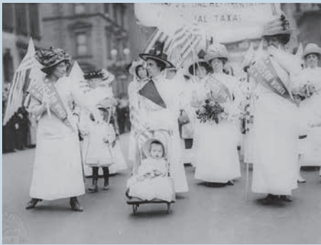
▲ Amerykańskie sufrażystki w czasie parady w Nowym Jorku w 1912 roku.

Dopiero reforma wyborcza Lloyda George'a, która wprowadziła zasadę wyborów powszechnych (1918), przyznała prawa wyborcze kobietom; jednakże mężczyzna głosował po ukończeniu 21 lat, kobiety – po ukończeniu 30 lat życia. Zrównanie praw kobiet i mężczyzn nastąpiło zresztą wkrótce potem (1928).