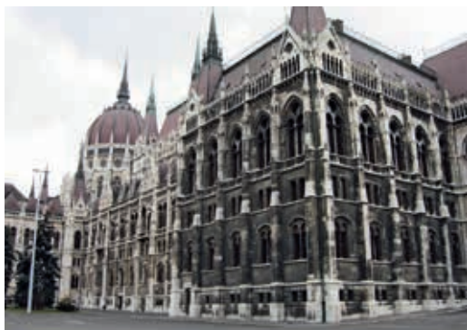
▲ Parlament w Budapeszcie. Sprawdź w sieci, dlaczego wielu obserwatorów życia politycznego zastanawia się, czy Węgry to nadal demokracja konstytucyjna.

Podział władz może mieć charakter zupełnej separacji ich uprawnień, tak aby ograniczyć możliwości wzajemnej ingerencji różnych organów władzy. Bardziej popularny jest jednak model, w którym uprawnienia władz do pewnego stopnia nakładają się na siebie, co umożliwi im wzajemne kontrolowanie się i równoważenie. Ten model nakłada na wszystkie organy władzy obowiązek współdziałania dla dobra publicznego, bo w niektórych przypadkach mogą one wzajemnie się blokować, uniemożliwiając rozwiązanie jakiegoś istotnego problemu obywateli.