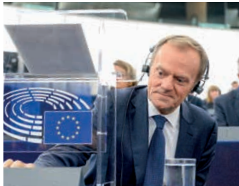
▲ Donald Tusk, premier Polski 2007–2014, przewodniczący Rady Europejskiej 2014–2019, jeden z założycieli ugrupowania Platforma Obywatelska.

To, że eksperci nie mogą zastąpić polityków, nie oznacza, że w pewnych sprawach ich głos nie może zostać uznany za decydujący. Współcześnie pewne obszary, tradycyjnie uznawane za polityczne, zostają wyłączone z demokratycznej gry i powierzone instytucjom eksperckim . Tak dzieje się np. z oceną zgodności ustaw z konstytucją (Trybunał Konstytucyjny) czy z problemami polityki pieniężnej (Rada Polityki Pieniężnej). Zwróćmy jednak uwagę na to, że i w takich instytucjach, nazywanych „ strażnikami demokracji ”, decyzje wcale nie zapadają jednogłośnie. Nawet więc w sytuacjach zdawałoby się jednoznacznych, gdy chodzi