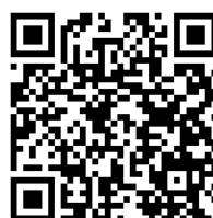
Kod QR nr 1. Film Narzędzia partycypacji społecznej

Zastanówcie się wspólnie z młodzieżą, co może stymulować proces większej partycypacji w działaniu społeczności lokalnej.