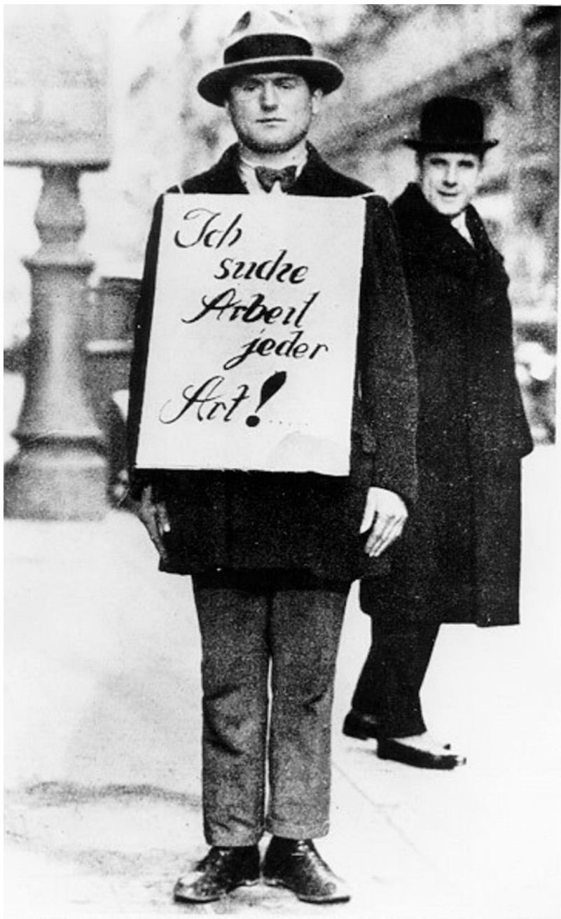
Podczas Wielkiego Kryzysu. Na tabliczce: „Szukam pracy – jakiegokolwiek”.