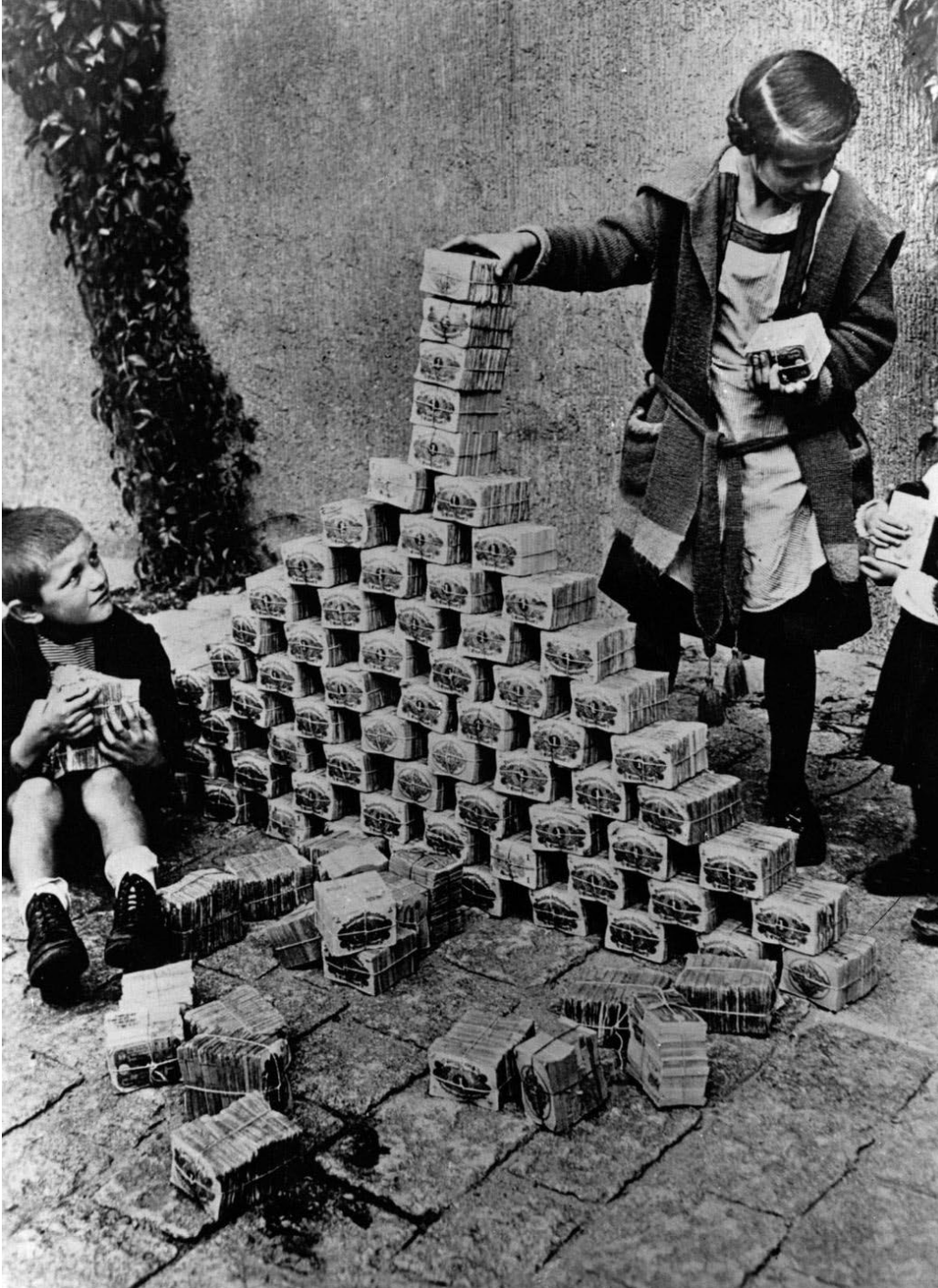
1922/3. Dzieci bawiące się bezwartościowymi banknotami podczas hiperinflacji w Niemczech.