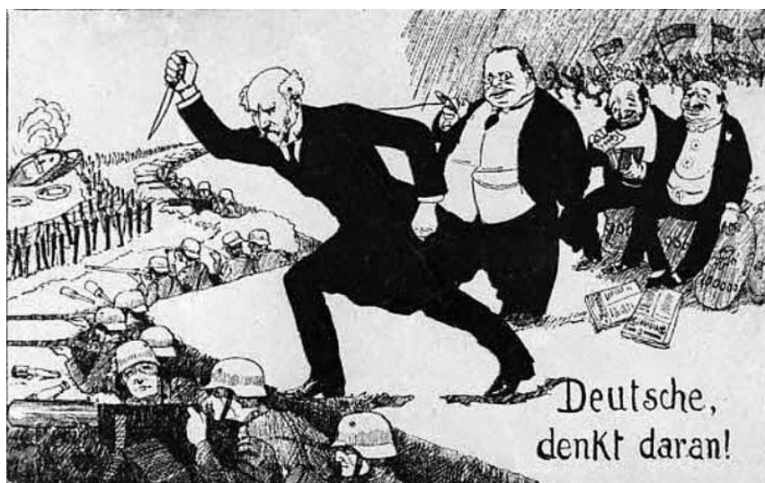
Propagandowa pocztówka z 1923 r.: „Niemcy, pamiętajcie o tym!”, ukazująca „cios w plecy” – rzekomo zadany niemieckiej armii w 1918 r. przez lewicowych polityków, kapitalistów i Żydów