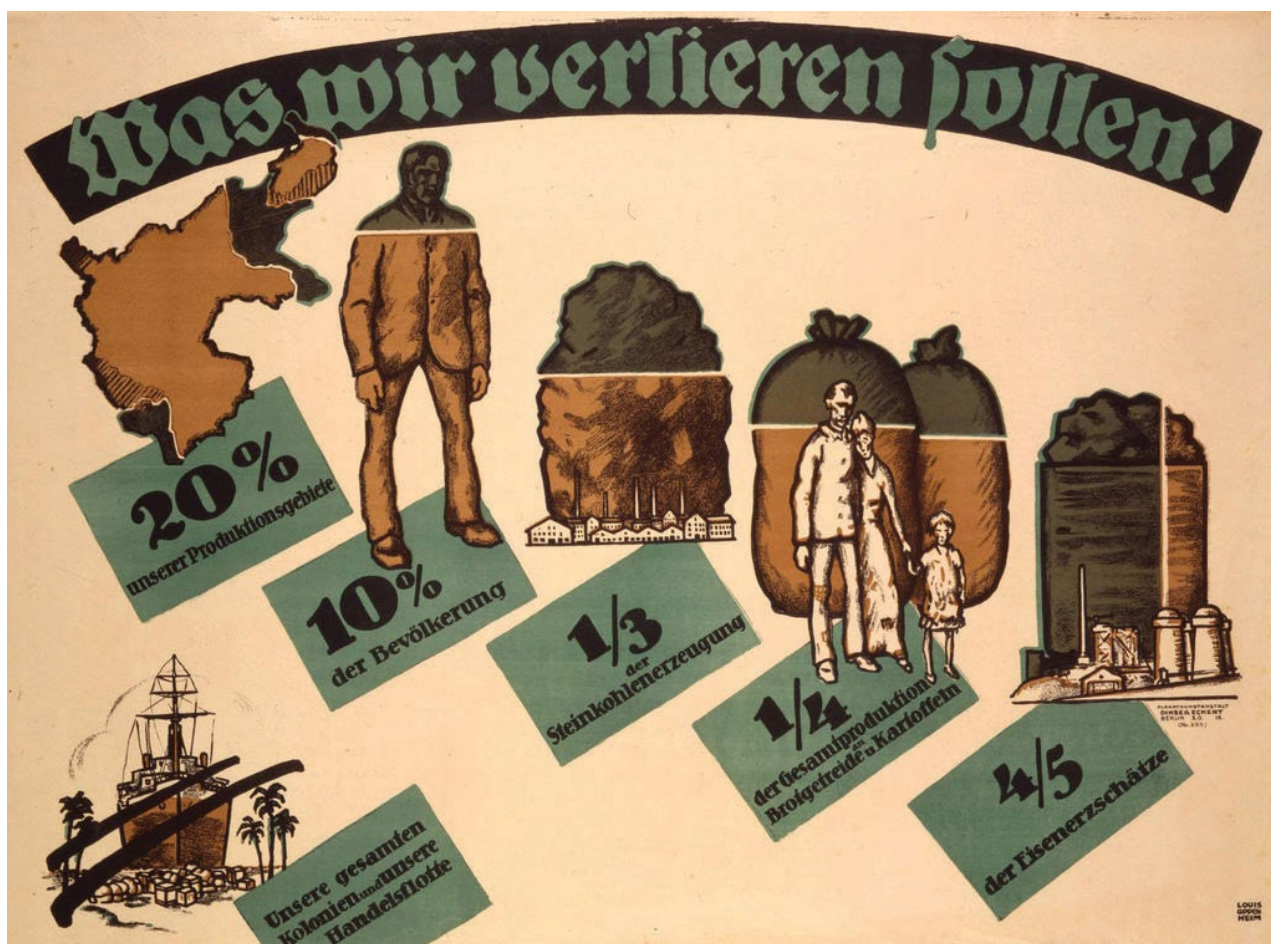
Niemiecki plakat z 1919 r. potępiający traktat wersalski z pytaniem „Co utracimy?” i odpowiedzią: „20% ziem, 10% ludności, 1/3 produkcji węgla kamiennego, 1/4 produkcji zbóż i kartofli, 4/5 rudy żelaza, wszystkie kolonie i flotę handlową”.