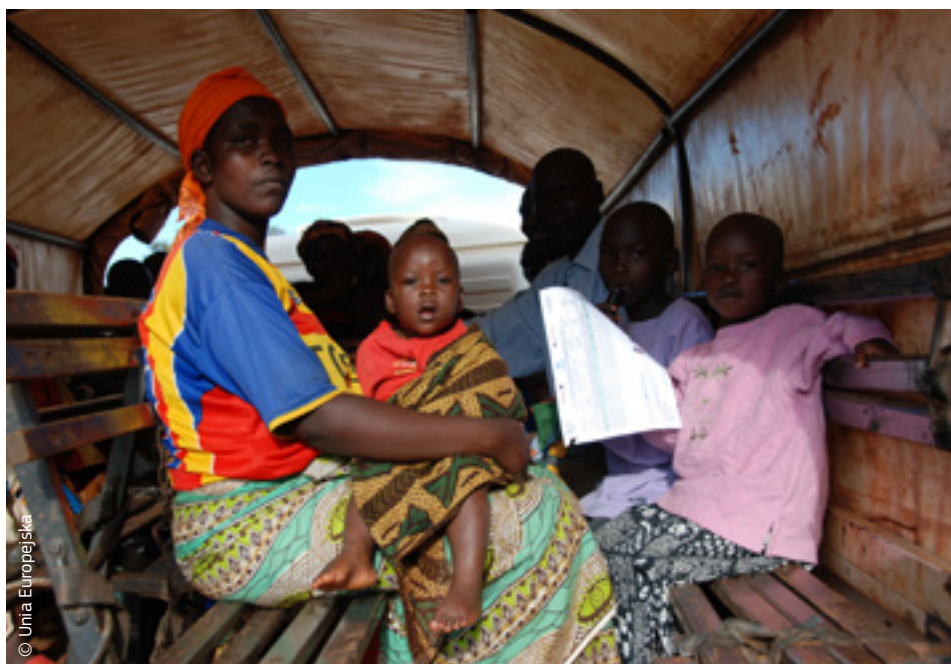
Burundyjska rodzina zmuszona do opuszczenia swojego domu mogła do niego wrócić dzięki pomocy UE.

Badanie Eurobarometru z 2015 r. pokazało, że poparcie społeczne dla pracy humanitarnej UE i wspólnego podejścia do ochrony ludności jest coraz większe i nadal rośnie. Dziewięciu na dziesięciu obywateli uważa, że UE powinna nadal finansować pomoc humanitarną, a ośmiu na dziesięciu powiedziało, że wspólne podejście do ochrony ludności jest skuteczniejsze niż działania poszczególnych państw.