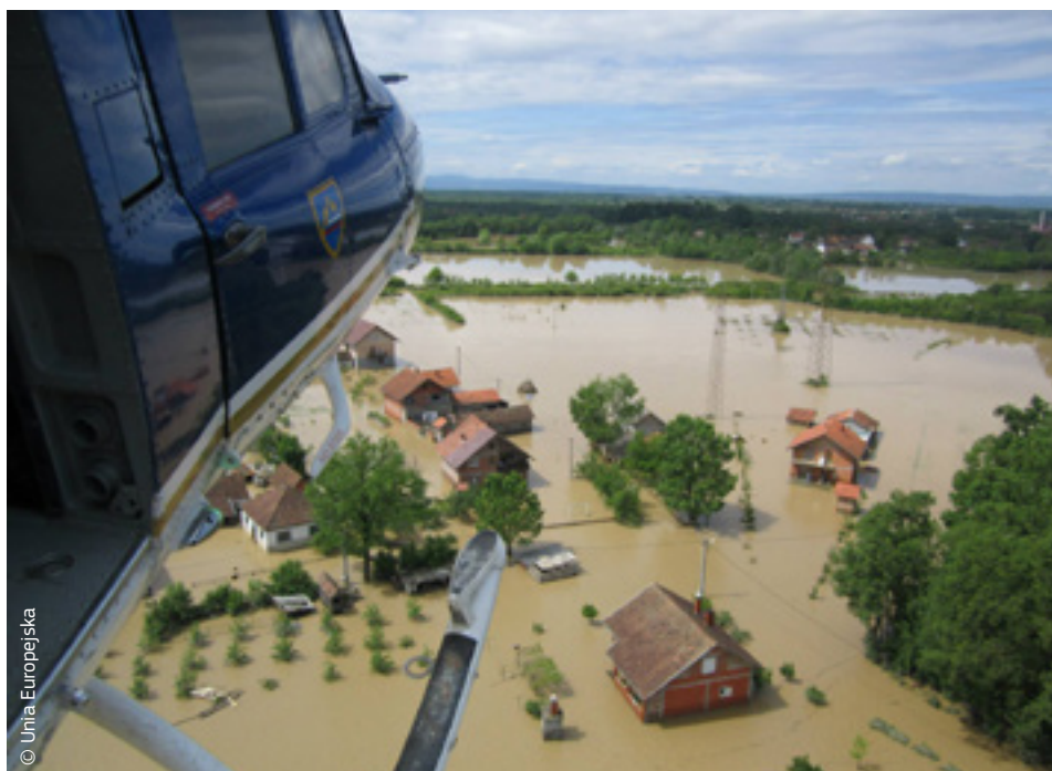
Słoweński helikopter niesie pomoc doraźną ofiarom powodzi w Bośni i Hercegowinie w ramach unijnego mechanizmu ochrony ludności.

Oprócz pomocy rzeczowej przekazanej przez państwa członkowskie UE za pośrednictwem unijnego mechanizmu ochrony ludności UE przeznaczyła również 3 mln euro w postaci pomocy humanitarnej dla najuboższych grup ludności w dwóch krajach dotkniętych klęską żywiołową. Dzięki temu pół miliona ludzi otrzymało pomoc, jednak w obu państwach niezbędne jest usuwanie skutków katastrofy i odbudowa na dużą skalę.