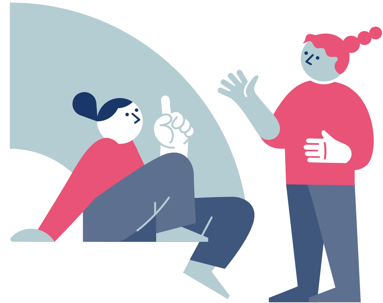
wymiana osobistych wrażeń i uwspólnienie wiedzy