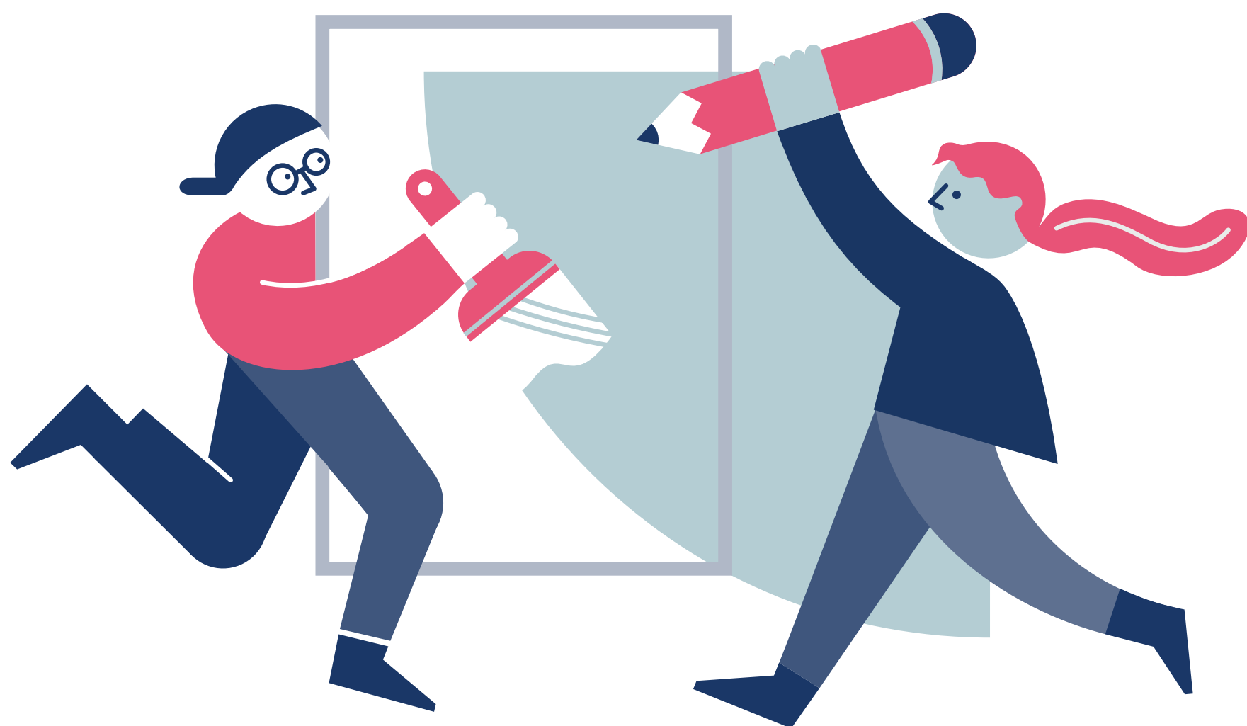
trening włączania nowej wiedzy do codziennych nawyków