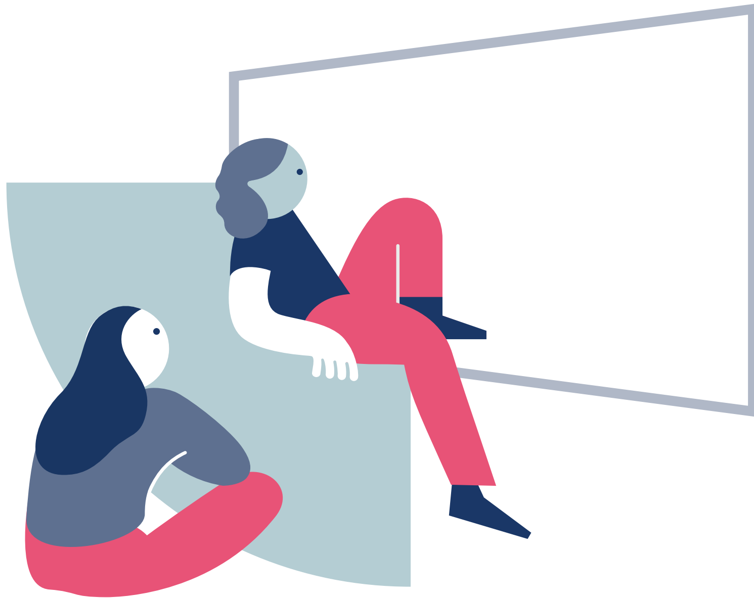
poruszający wgląd w życiowe doświadczenia