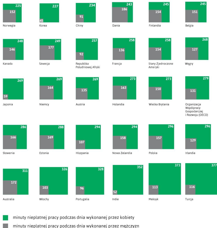
Diagram pokazujący różnice w ilości wykonywanej pracy niepłatnej przez kobiety i mężczyzn w wybranych krajach