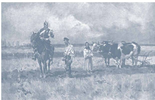
Wojciech Kossak, „Rugi pruskie”, 1909. Niemiecki żandarm odczytuje nakaz opuszczenia przez Polaków ziem Rzeszy.