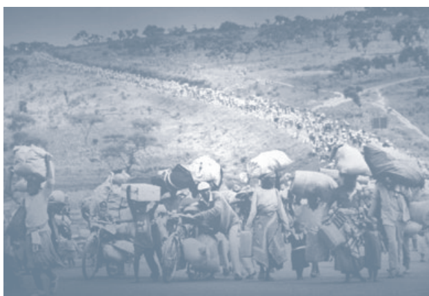
„Wędrówka przez łąy: afrykańska podróż” (ang. Trek of Tears , An African Journey ), 1998 Pulitzer Prize, Spot News Photography, Martha Rial, Pittsburgh Post-Gazette

Źródło: CC BY 2.0 Cliff, www.flickr.com/photos/nostri- imago/5000122164/