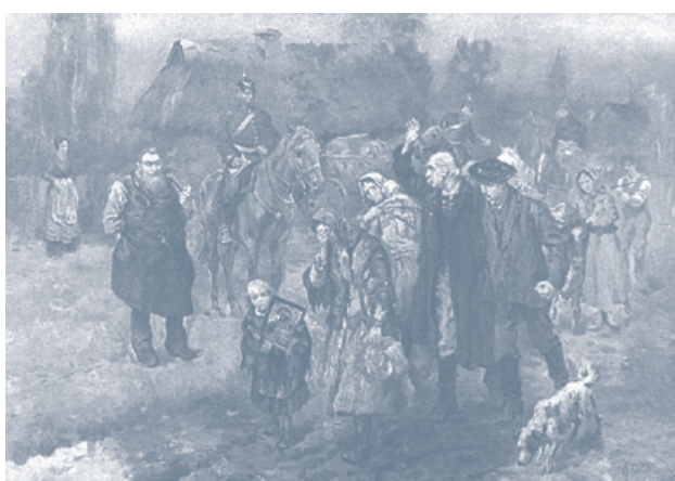
Konstanty Górski, „Rugi pruskie”, 1915. Polacy opuszczają ziemie Rzeszy.