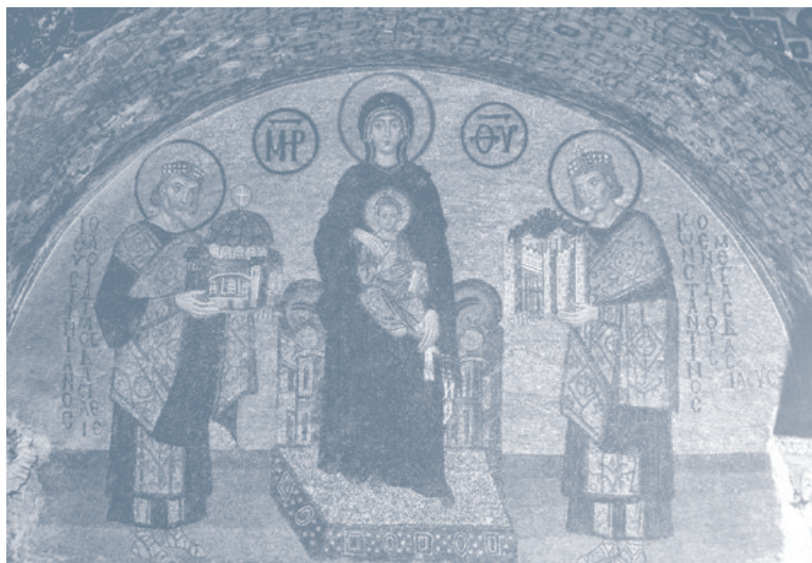
Sobór w Kijowie, mozaika z XI w.